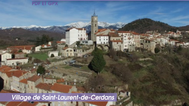
Village de Saint-Laurent-de-Cerdans