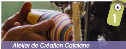
Atelier de Création Catalane