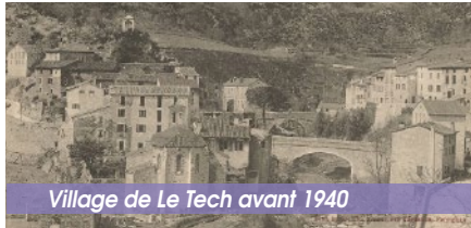
Village de Le Tech avant 1940

Le Tech est un nœud stratégique, car il est à la croisée de deux vallées. Les premiers habitants y trouvèrent refuge au IX e siècle pour fuir les invasions arabes et normandes. Ils s'installèrent d'abord sur les flancs de la Comelada, puis, en 1492, au lieu-dit « Les Planes ». Des migrants venus essentiellement de Ligurie y construisirent le village autour de la forge (à l'endroit actuel des maisons situées au-dessus du court de tennis). Ce sentier, où l'on voyait passer les trains de mu-