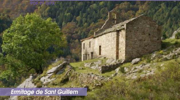
Ermilage de Sant Guillem