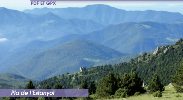
Pla de l'Estanyol