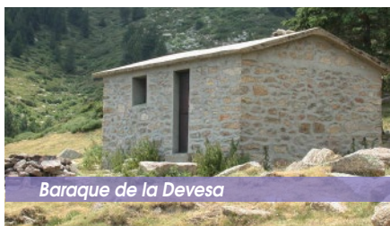
Baraque de la Devesa

Le long du parcours vous pourrez découvrir plusieurs vestiges de plateformes charbonnières de forêt. Celles-ci sont reconnaissables par la présence de petits bouts de charbon. Ces derniers étaient un élément indispensable pour faire fondre le minerai de fer extrait du massif du Canigó.