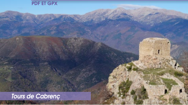
Tours de Cabrenç