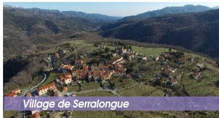
Village de Serralongue

C'est un magnifique village du Vallespir. Vous y trouverez un remarquable petit musée avec des vitrines animées expliquant le travail du fer catalan. Au cœur du village, derrière l'église se trouve le «Conjurador». Quant à l'église romane en granite rose, elle est du XI e siècle. Son chœur est orné d'un retable baroque.