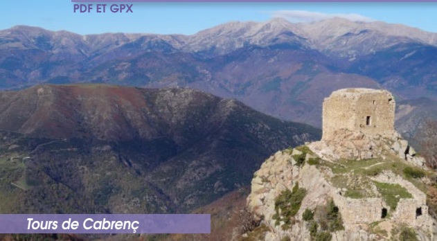
Tours de Cabrenç